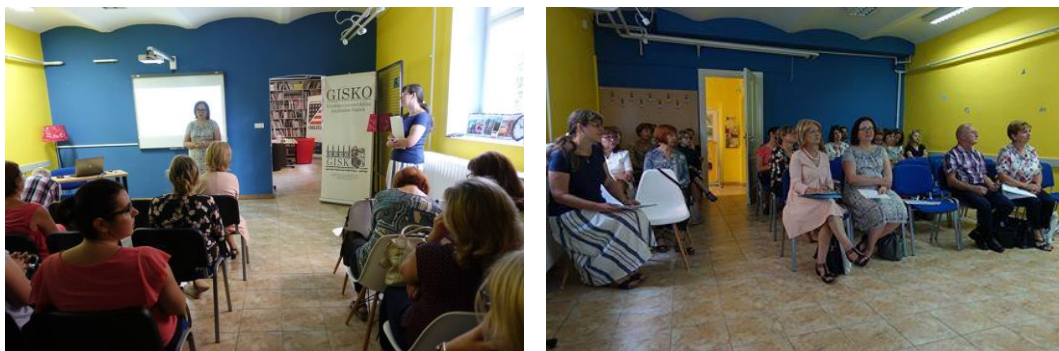
Slika 1. i 2. Sudionici 3. okruglog stola: Zavičajni fondovi i zbirke u knjižnicama panonskog prostora