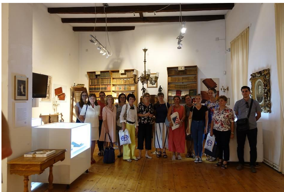
Slika 10. Posjet Muzeju Slavonije