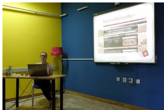
Slika 8. i 9. Drugi blok predavanja

Zaključeno je kako treba održati kontinuitet u održavanju okruglog stola, okupljanju dobrih praksi ne bi li ostvareni rezultati bili pretraživi i dostupni što širem krugu korisnika, a jedna od budućih tema trebala bi biti rješavanje pitanja autorskih prava te obnavljanje projekta suradnje „ S obje strane granice “.