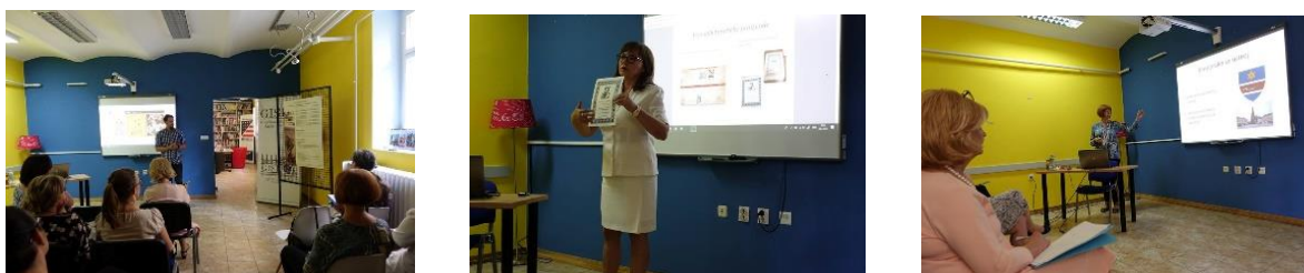
Slika 5., 6. i 7. Drugi blok predavanja