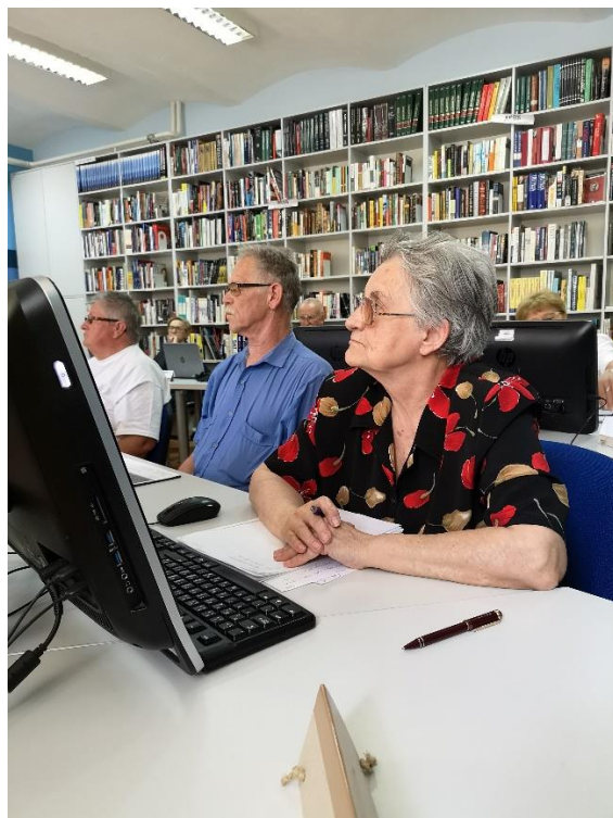
Slika 3. Polaznici radionica