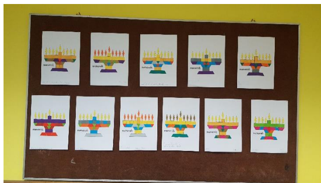
Slika 2., 3., 4. Tjedan židovske kulture

Potreba suvremene škole je osigurati kvalitetne uvjete rada koji su podloga za ostvarenje timskoga rada. Timski rad su aktivnosti skupine pojedinaca koji moraju djelovati kao jedno kako bi uspješno ostvarili postavljene ciljeve.