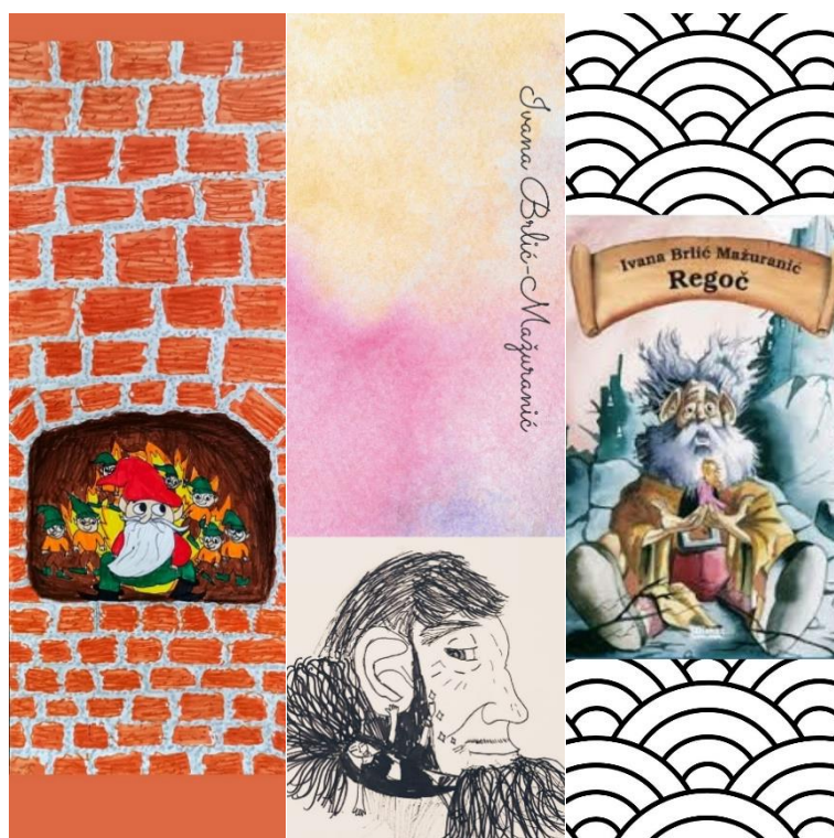
Fotografija 7: digitalni straničnici izrađeni u alatu Canva na temu "Priča iz davnine"

Ovogodišnji školski projekt "Čitanje bez muke" provodi se od rujna 2021. do lipnja 2022. a u njemu će sudjelovati svi učenici drugih, trećih i četvrtih razreda razredne