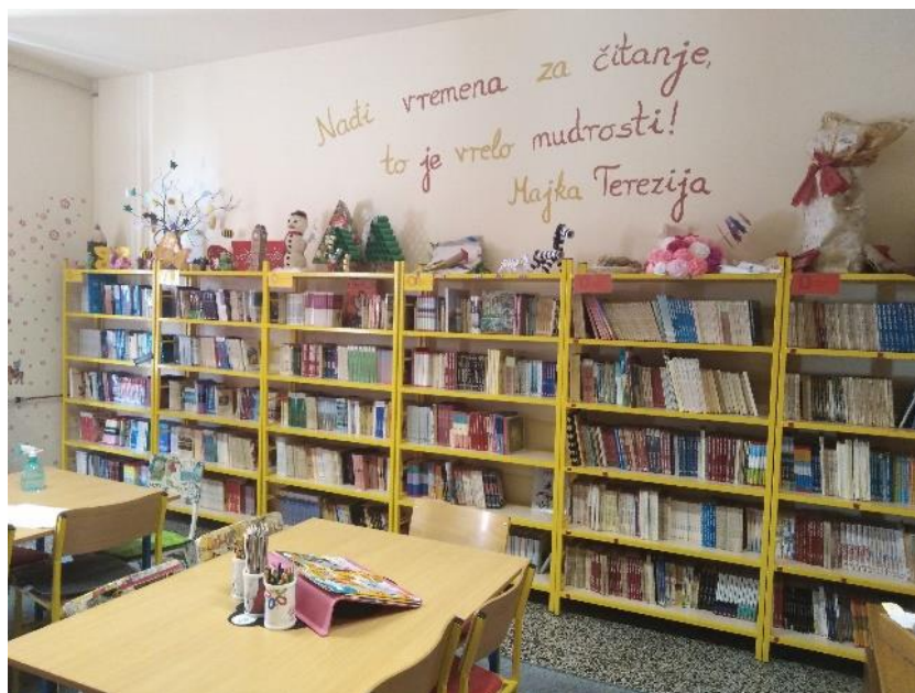
Fotografija 1: školska knjižnica

Prije zadnjeg renoviranja škole, 2014. godine, školska knjižnica nalazila se u prizemlju zgrade i bila je sastavljena od dva kabineta nespretno spojena u školsku knjižnicu (Fotografija 1). Novi prostor, iako kvadraturom nije velik (40 m 2 ), puno je bolje iskorišten i uređen, te je postao prostor u koji učenici rado dolaze.