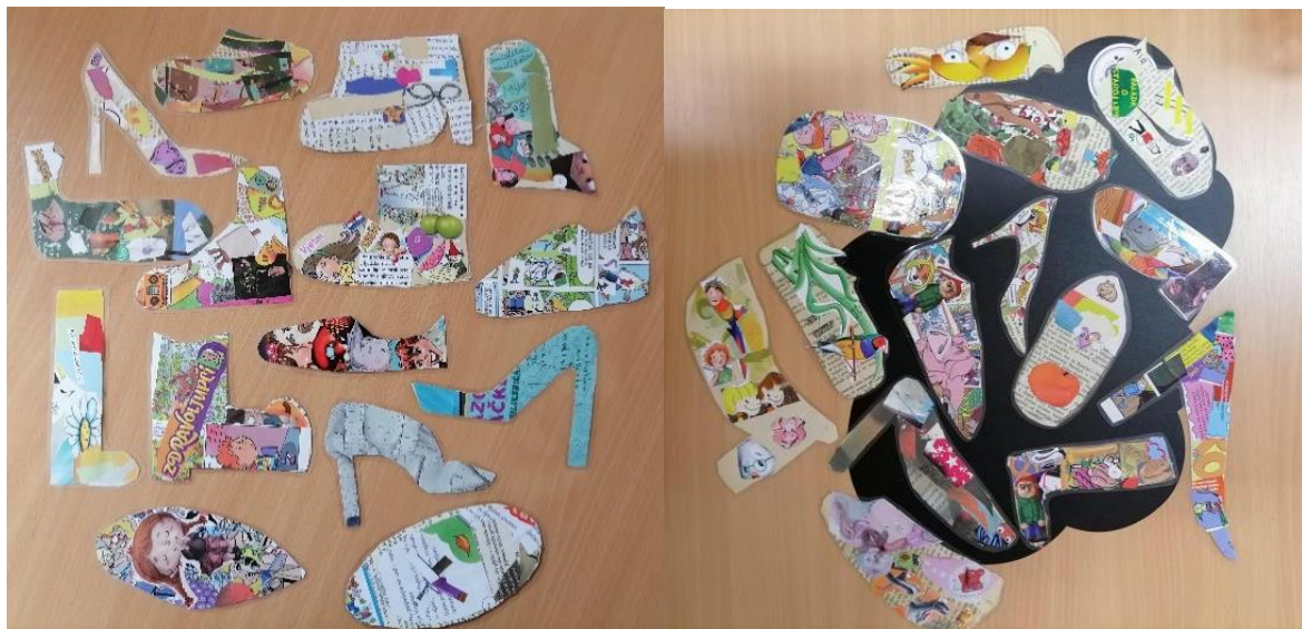
Fotografija 6: straničnici učenika četvrtih razreda na temu narodne bajke "Kraljeva kći vještica"