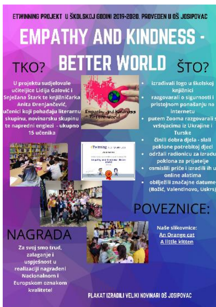
Fotografija 9: Poster koji su učenice izradile u alatu Canva