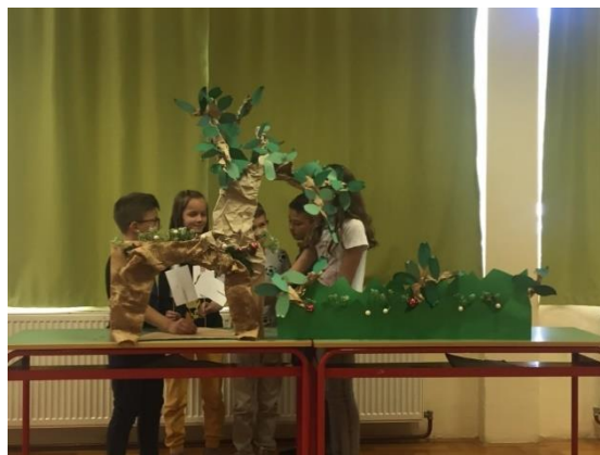
Fotografija 2: Učenici interpretiraju djelo „Ježeva kućica“

Suradnja knjižničarke i učiteljice Andrijane Sili realizirana je kroz nekoliko radionica poticanja čitanja. Djelo Branka Ćopića "Ježeva kućica" obradili smo kao igrokaz koristeći scenografiju i likove koju smo sami izradili (Fotografija 2), dok smo lekturu "Kaktus bajke" Sunčane Škrinjarić realizirali koristeći kamišibaj (Fotografija 3). Time se kod učenika razvija ljubav prema čitanju i pročitanoj, potiču jezične i govorne vježbe te se priprema učenike za scenske nastupe.