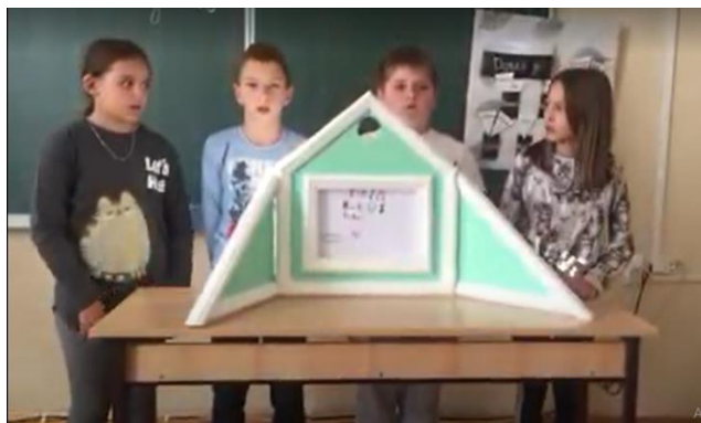
Fotografija 3: Kamišibaji tehnika kojom učenici interpretiraju djelo "Kaktus bajke"

Projekti se u školskoj knjižnici provode u suradnji s učiteljicama i učiteljima naše škole pri čemu bismo posebno istaknuli eTwinning projekte, temeljem kojih je i naša škola u dva navrata proglašena eTwinning školom (2019.-2020. i 2021.-2022).