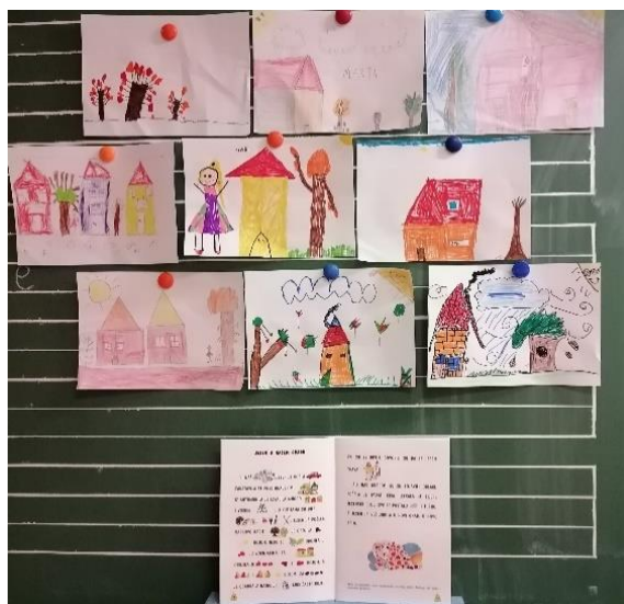
Fotografija 8: radovi učenika prvog razreda nastali na Pričaonicama – oslikali su jednu Slikopriču Željke Horvat Vukelja

U organizaciji Hrvatskog čitateljskog društva 23. listopada, povodom obilježavanja Mjeseca hrvatske knjige 2021. održan je virtualni maraton čitanja "Minuta za čitanje". U virtualni maraton čitanjem u knjižnici uključili su se i učenici našeg 3.b razreda s učiteljicom Andrijanom Sili i knjižničarkom. Video se može pogledati na poveznici: "Minuta za čitanje" u knjižnici OŠ Josipovac - YouTube . Tradicionalno u školskoj knjižnici obilježavamo i Mjesec hrvatske knjige "Pričaonicama" za najmlađe učenike (Fotografija 8) te Noć knjige radionicama za učenike raznih uzrasta. Prošlogodišnja Noć knjige obilježena je radionicom "Poezije zatamnjenja (blackout poetry)" a uratke naših učenika možete vidjeti i na padletu: NOĆ KNJIGE 2021. (padlet.com) .