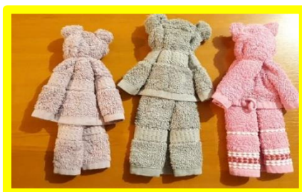
Slika 11. Medvjedići od ručnika