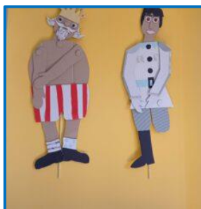
Slika 4. Plošne lutke