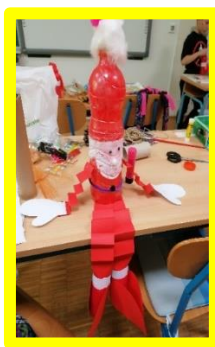
Slika 10. Lutka Djed Mraz

Suvremeni školski programi u značajnoj se mjeri bave razvijanjem ekološke svijesti učenika i važnosti održivog razvoja, tako da se i pri izradi lutaka preporuča korištenje materijala kao što su stare kutije, boce, iskorištena tkanina ili ambalaža koju učenici donose od kuće. Osim što učenici postaju ekološki svjesniji, upotreba navedenih materijala izrazito je ekonomična. Naravno, kao lutka može poslužiti sve ono čemu učenici žele i mogu dati život, ono čime se svakodnevno igraju, što mogu pokrenuti svojom maštom. Primjeri izrađenih lutaka nalaze se na slici 10 (Djed Mraz), slici 11 (medvjedići od ručnika) i slici 12 (lutka-čudovište od kartonske kutije).