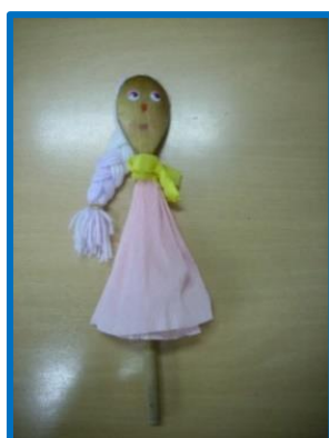
Slika 8. Primjer lutke na štapu od kuhače

U našim školama najradije i najčešće izrađuju se lutke na štapu ili kuhači. Dopadljive su, njihova izrada ne iziskuje previše vremena, ali je potrebna kreativnost i mašta. Može ih se odjenuti u odjeću od papira ili tkanine, a kreativnost se traži i u izradi i uređivanju kose. Učenici zaista uživaju.