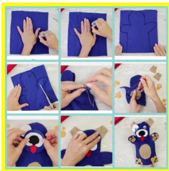
Slika 6. Primjer izrade ručne lutke

Izrada je lutaka jednostavna, lako primjenjiva u školskim uvjetima, a najfunkcionalnije je da ih djeca uz malo poticaja i mašte sama stvaraju ili barem sudjeluju pri njihovoj izradi.