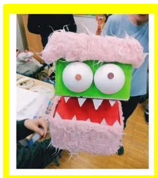
Slika 12 . Lutka-čudovište od kartonske kutije