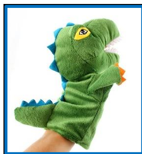
Slika 5. Ručna lutka