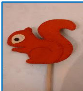
Slika 1. Lutka na štapu