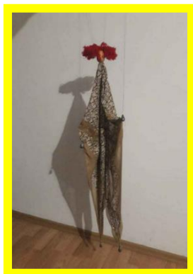
Slika 9. Primjer lutke na koncu

Također, učenici mogu oponašati lutku, recimo na koncu. Jedan je učenik lutka – opuštena. Drugi učenik govorom signalizira i pokazuje kako zamišljenim koncem diže lutkin lakat, glavu. Umješnost učenika lutke jest u tome da zaista dočarava ljuljanje noge ili glave na koncu. Čine pokrete, nakon čega se mogu zamijeniti. Učenici se nastoje kretati kao lutke u prostoru. Video-uradak učenice s lutkom maramonetom 6 dostupan je na poveznici. 7