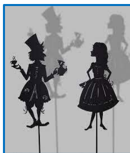
Slika 3. Lutke sjene