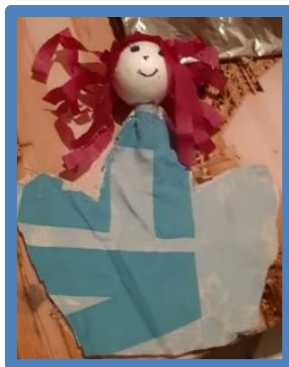
Slika 7. Primjer ručne lutke ginjol