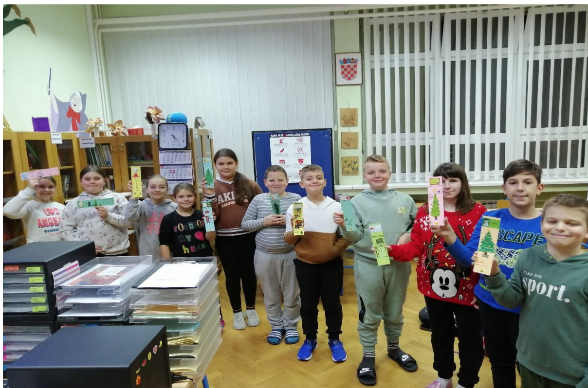
Fotografija 8. Straničnici učenika četvrtih razreda OŠ Borovo

Po prvi put učenici četvrtih razreda naše škole prijavili su se za sudjelovanje u međunarodnom projektu naziva „Projekt razmjene straničnika“. Iz tih je razloga 8. prosinca 2022. godine u prostoru školske knjižnice održana radionica izrade straničnika s božićnim motivima iz našeg mjesta (Fotografija 8.). Učenici njihova uzrasta iz Litve, koji su nam bili ovogodišnji partneri, poslali su nam svoje straničnike tako da smo na kraju radionice u izložbenom prostoru školske knjižnice organizirali izložbu istih straničnika. (Fotografija 9.).