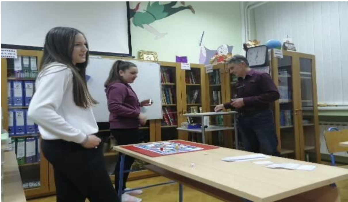
Fotografija 1. Društvena igra „Zajedno za bolji Internet“

U uvodnom dijelu radionice, polaznici su imali priliku upoznati se s najnovijim pokazateljima i aktualnostima iz svijeta interneta, učestalosti korištenja aplikacija za komunikaciju, društveno umrežavanje i igranje igrice na pametnom telefonu. Zatim je uslijedila radna aktivnost u grupama sa zadatkom tako da se osmisle smjernice za zaštitu od elektroničkog nasilja. Iste smjernice učenici su trebali napisati na radni list. Po završetku smo uspoređivali napisano između svih grupa. Sljedeća radna aktivnost bila je Internetski bonton. Bilo je potrebno osmisliti pravila lijepog ponašanja na internetu. Učenici su podijeljeni u grupe, a ista pravila trebali su napisati na radnim listićima. Po završetku iste aktivnosti, zajednički smo usporedili i proanalizirali ista pravila lijepog ponašanja. Na kraju radionice osmislili smo društvenu igru po sistemu kako se igra „Čovječe, ne ljuti se“ i prigodno je nazvali „Zajedno za bolji Internet“ (Fotografija 1).