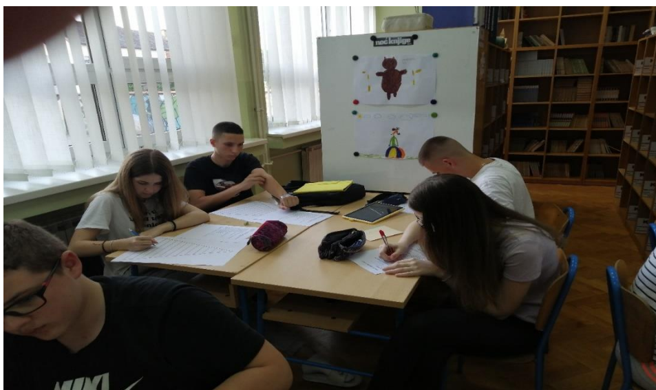
Fotografija 4. „Najvažnije mi je!“

Prilikom posljednje aktivnosti radionice svaki učenik dobio je A-3 format papira, na kojem je bila nacrtana piramida, a zadatak je bio da, sukladno Maslowljevoj hijerarhiji potreba, rangiraju svoje potrebe tako da na dno piramide stave one koje su najvažnije, a na vrh one koje su najmanje važne. Nakon napravljenog zadatka, knjižničar je pokupio iste papire, izmiješao ih i nasumično ih podijelio učenicima radionice. Svaki je učenik pred svima pročitao potrebe iz piramide koju je izvukao, a nakon toga je uslijedio razgovor, rasprava i komentari, slaže li se isti učenik s potrebama koje su navedene u istoj piramidi ili se njegova razmišljanja u vezi istoga razlikuju, slična su ili djelomično slična. (Fotografija 4.)