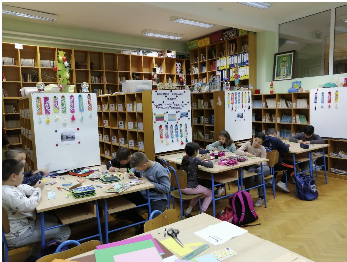
Fotografija 9. Izložba straničnika u prostoru školske knjižnice učenika četvrtih razreda iz Litve