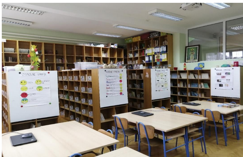
Fotografija 7. Izložba plakata o emocijama u školskoj knjižnici

Kod sljedeće aktivnosti učenici su bili podijeljeni u četiri grupe. Potrebno je bilo napraviti plakat od papira formata A3, koristeći bojice, markere, ljepilo i ostali potrebni pribor i materijal za izradu plakata. Prva je grupa trebala izraditi plakat koji govori o osnovnim emocijama, druga o složenim emocijama, treća o ugodnim emocijama i četvrta o neugodnim emocijama. Na kraju, svaka grupa prezentira svoj plakat, a o pobjedniku odlučujemo svi zajedno javnim glasovanjem. Urađene plakate iskoristili smo tako što smo priredili izložbu u prostoru školske knjižnice. (Fotografija 7.).