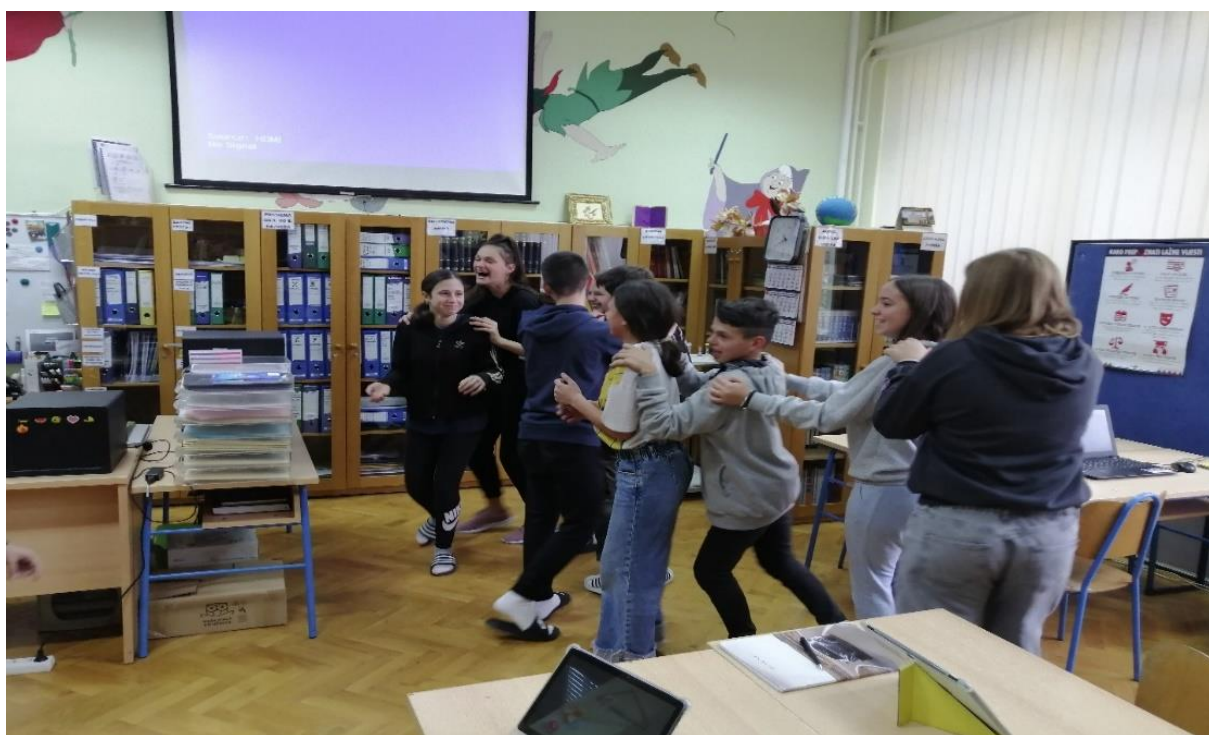
Fotografija 5. Igra pokreta „Zaraza emocija“

Istu radionicu počeli smo igrom pokreta pod nazivom „Zaraza emocija“. Određena su dva učenika od kojih će jedan predstavljati „LJUTNJU“, a drugi „SREĆU“. Oni su zaraženi istim emocijama i na taj način predstavljanju prijenosnike emocija. Isti učenici love ostale učenike po knjižnici tako da dotaknu učenika po ramenu. Ulovljeni je učenik „zaražen“ i sada je on prijenosnik koji ponavlja geste i izraze lica. Zatim prijenosnik položi ruke zaraženom na ramena te se zajedno kreću jedan iza drugoga i prenose emociju do sljedećeg učenika. Učenik koji je posljednji zaražen emocijom uvijek je prvi u redu pa je stoga i sljedeći prijenosnik. Igra završava onda kada svi učenici dođu na red, a pobjednik je ona grupa koja ima više učenika. (Fotografija 5.)