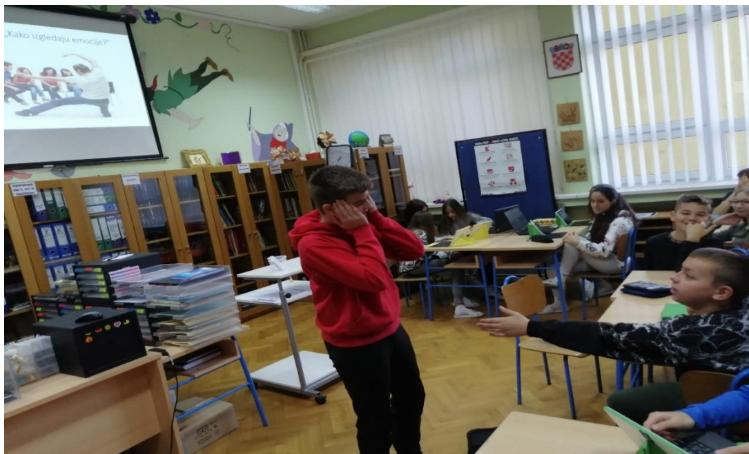
Fotografija 6. Igra pantomime „Kako izgledaju emocije?“

Kod sljedeće aktivnosti učenici su bili podijeljeni u četiri grupe. Potrebno je bilo napraviti plakat od papira formata A3, koristeći bojice, markere, ljepilo i ostali potrebni pribor i materijal za izradu plakata. Prva je grupa trebala izraditi plakat koji govori o osnovnim emocijama, druga o složenim emocijama, treća o ugodnim emocijama i četvrta o neugodnim emocijama. Na kraju, svaka grupa prezentira svoj plakat, a o pobjedniku odlučujemo svi zajedno javnim glasovanjem. Urađene plakate iskoristili smo tako što smo priredili izložbu u prostoru školske knjižnice. (Fotografija 7.).