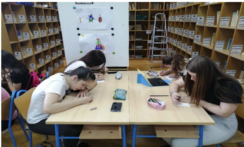
Fotografija 2. „Opiši kolegu ili kolegicu iz razreda“

U sljedećoj aktivnosti svaki je učenik dobio radni listić na kojem je trebao napisati kako izgleda (boja kose, visina, težina), koji nastavni predmet najviše vol, a koji ne, za što slobodno vrijeme najviše koristi (ima li hobi), što najviše voli od sportskih aktivnosti, što najviše cijeni od ljudskih vrijednosti, što ga najviše interesira, smatra li da su njegove sposobnosti najviše vezane za intelektualne, motoričke ili senzorne i na kraju, koje će biti njegovo buduće zanimanje. (Fotografija 3.)