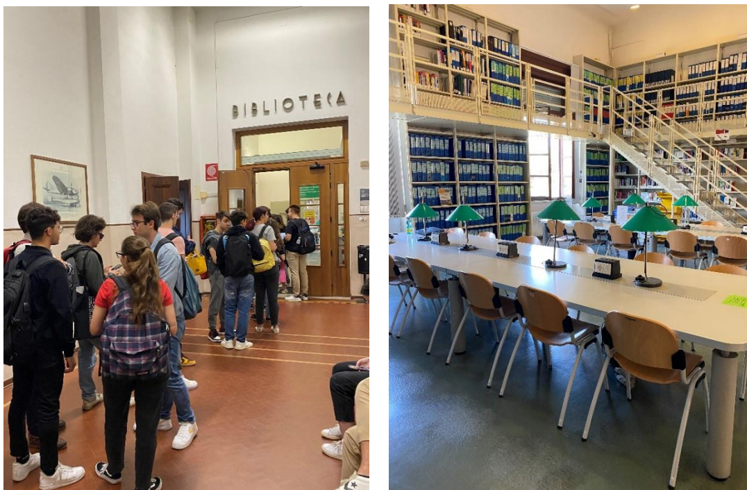
Slika 6. Knjižnica Tehničkog fakulteta, Pisa

više vremena za stručne poslove. Slobodno poslijepodne provedeno je u Pisi, u ugodnoj šetnji po šetnici uz rijeku Arno, razgledavajući divnu arhitekturu i znamenitosti Pise.