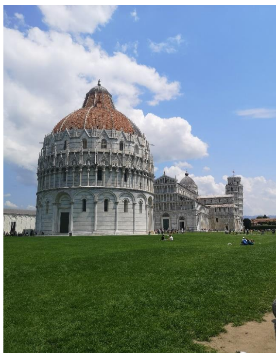
Slika 3. Katedralni trg, Pisa

Sljedeći je dan bilo organizirano okupljanje u konferencijskoj dvorani knjižnice Pravnog fakulteta i političkih znanosti. Svi sudionici ERASMUS+ programa, kao i domaćini, održali su izlaganje o svom sveučilištu i knjižnici, o vrsti poslova koje svatko obavlja i samom načinu organizacije i poslovanja. Druženje je bilo informativno, opušteno i