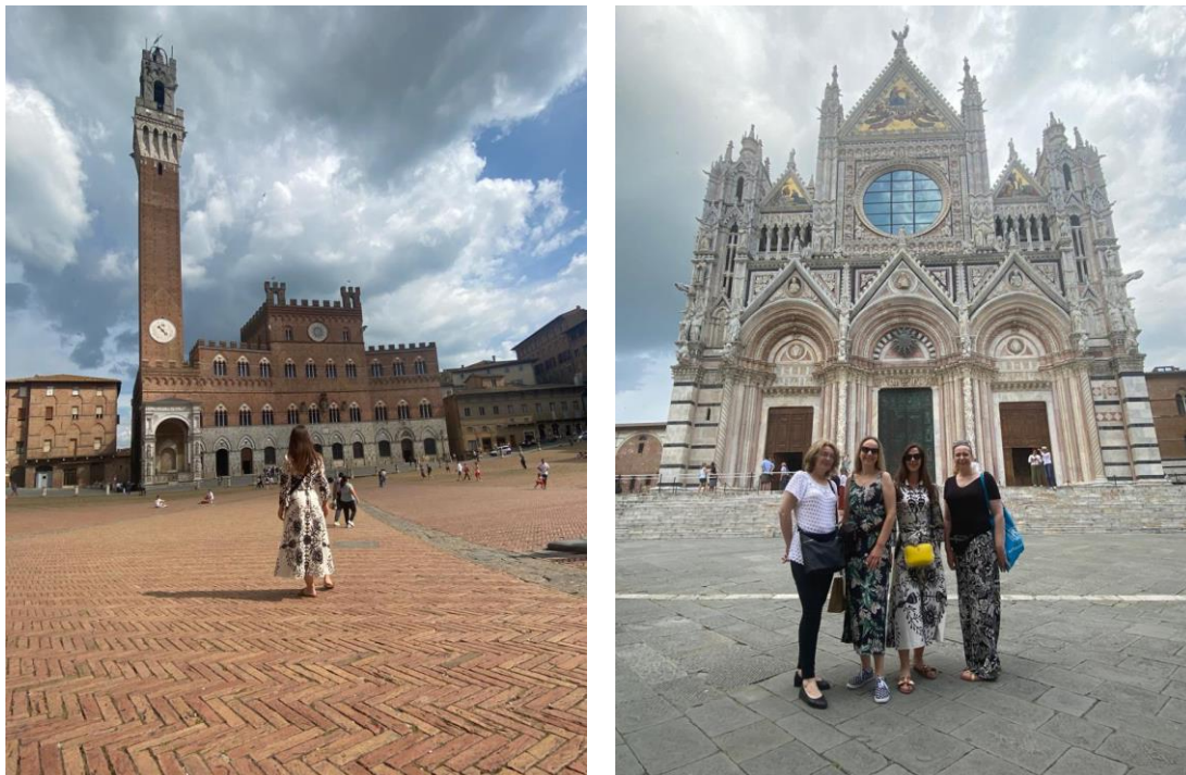
Slika 5. Siena

Četvrtog je dana na rasporedu bio posjet Knjižnici tehničkog fakulteta. Prilikom dolaska zapažen je dugačak red. Studenti dođu ranije i čekaju da se knjižnica otvori kako bi osigurali svoje mjesto u čitaonici, koja je cijeloga dana puna studenata, a broji preko 150 sjedećih mjesta. Na susretu nam je detaljnije objašnjen njihov sustav međuknjižnične posudbe i posebna platforma za razmjenu digitalnih dokumenata. Već i u ranije posjećenim knjižnicama uočeno je da se studenti sami poslužuju literaturom te da ih knjižničari samo upućuju (ukoliko su novi) gdje se što nalazi. Prilikom upisa, studenti i drugi korisnici budu upućeni na edukacijske materijale na njihovoj mrežnoj stranici koje donose informacije o uvjetima posudbe i korištenju građe, kako je ona smještena te kako sami mogu pregledavati kataloge i signature da bi se mogli neometano koristiti građom samostalno. Za informacijskim pultom najčešće rade studenti, dok knjižničarima ostaje