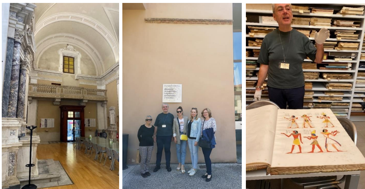
Slika 2. Salezijanska knjižnica, Pisa