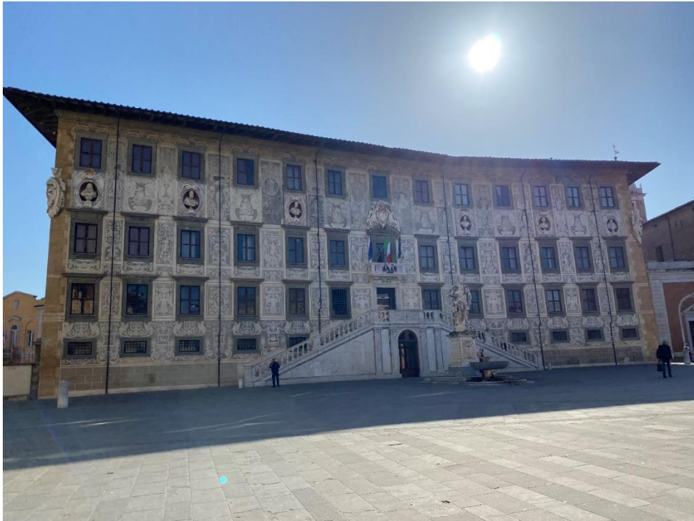
Slika 1. Scuola Normale Superiore, Pisa

Prvi dan posjećena je Salezijanska knjižnica koja sadrži građu iz lingvistike, germanistike, slavistike i drevnih kultura. Tom prigodom izneseni su i prikazani rukom oslikani originalni crteži umjetnika koji su među prvima u svijetu na ekspedicijama proučavali egiptologiju, a velik dojam ostavlja i jedna od čitaonica koja se nalazi u prostoru Crkve, koja je dostupna svim korisnicima za korištenje. Već u prvoj knjižnici uočeno je da se korisnici sami služe građom, raspolažu visokim stupnjem knjižnične pismenosti te da su čitaonice pune studenata koji tamo borave i uče. Kolege knjižničari objasnili su svoje sustave nabave i održali predavanje o sustavima razmjene informacija između sveučilišta u Firenci i Sieni. Organiziran je posjet u prekrasni botanički vrt (Orto Botanico di Pisa) koji se nalazi nedaleko od Salezijanske knjižnice u samom srcu grada i najstariji je sveučilišni botanički vrt u Europi. Tijekom slobodnog vremena posjećen je nezaobilazni Kosi toranj u Pisi te ostale znamenitosti na katedralnom trgu u Pisi koje se nalaze na UNESCO-vu popisu svjetske baštine u Europi.