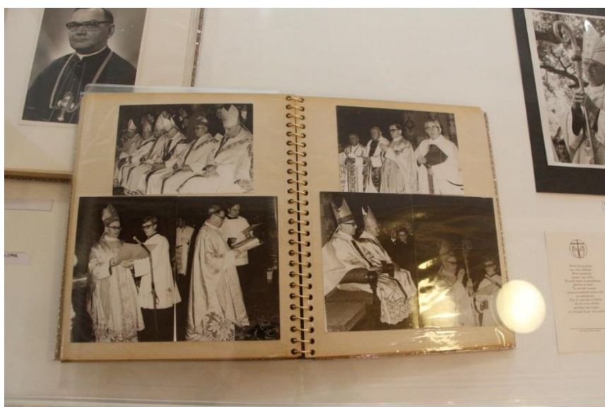
Slika 6. (Zlatna misa u Harkanovcima 5. kolovoza 1994.)