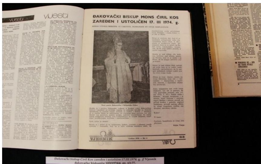
Slika 5. Život i djelovanje u serijskim publikacijama