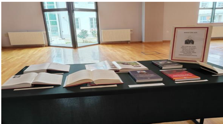
Slika 4. Monografska izdanja