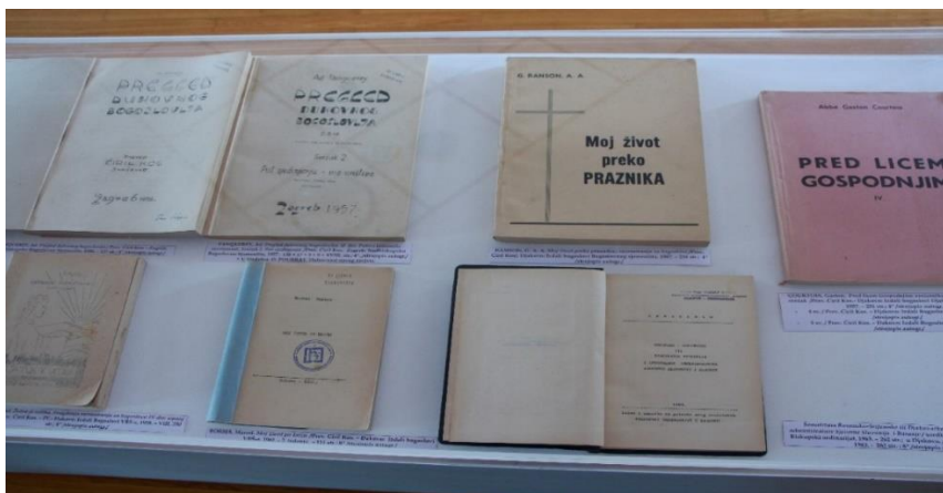
Slika 2. Prevoditeljski rad biskupa Ćirila