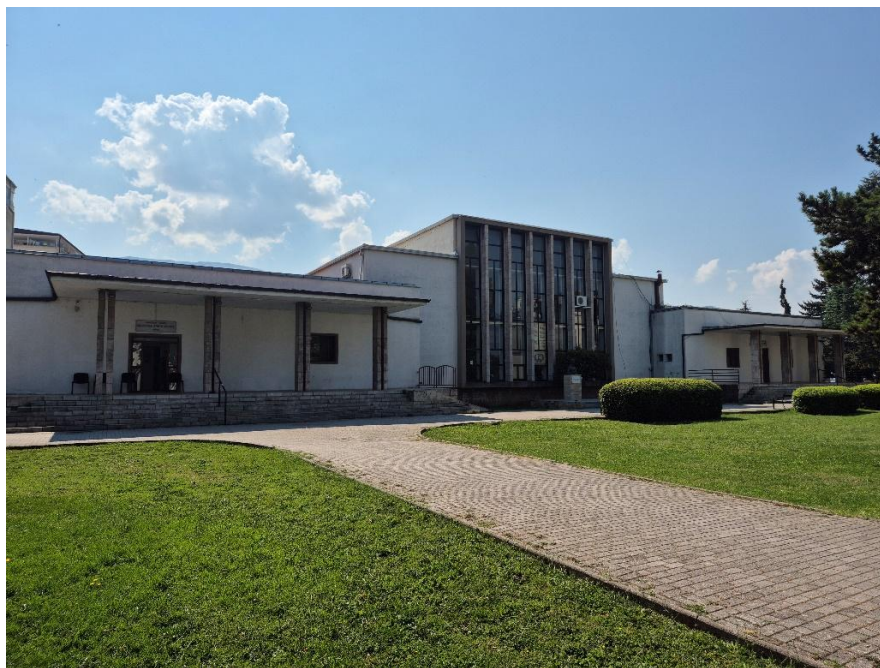
Slika 2. Narodna knjižnica „Grigor Prličev“