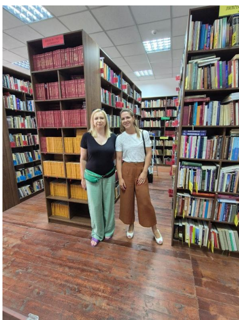
Slika 4. Narodna knjižnica „Grigor Prličev“

identiteta kroz knjižničnu djelatnost. Knjižnica „Grigor Prličev“ time nije samo mjesto posudbe knjiga, nego i centar za kulturnu i obrazovnu aktivnost u gradu. Uz to valja spomenuti da se unutar knjižničnog prostora nalazi i kino-dvorana. Takvo prostorno rješenje na prvi pogled djeluje zanimljivo i inovativno jer knjižnicu povezuje s kulturnim i društvenim životom zajednice. Ipak, u praksi ono donosi i određene izazove u svakodnevnom radu. Tijekom projekcija filmova prostor zna biti vrlo prometan i bučan, što otežava koncentrirani rad i korištenje knjižničnih usluga. Osim toga, za vrijeme prikazivanja filmova privremeno je onemogućen pristup dijelu spremišta, što zahtijeva dodatnu organizaciju i prilagodbu rasporeda knjižničnih aktivnosti.