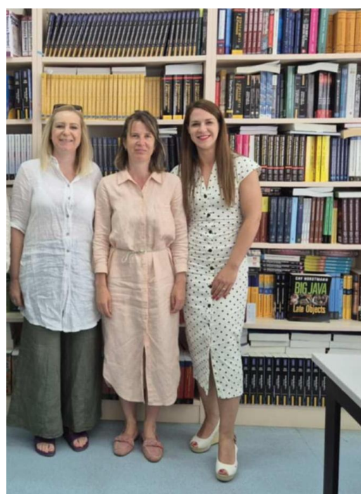
Slika 1. Sveučilište informacijskih znanosti i tehnologije „St. Paul the Apostle“, knjižnica

Jedan od dana mobilnosti bio je posvećen posjetu Narodnoj knjižnici „Grigor Prličev“ u samom središtu Ohrida. Knjižnica s bogatom tradicijom posjeduje fond od oko 150.000 jedinica građe. Kolege su s velikim entuzijazmom predstavili svoje zbirke, uključujući zavičajnu građu, periodiku i referentnu literaturu, a omogućili su i uvid u spremišta i načine pohrane različitih vrsta materijala.