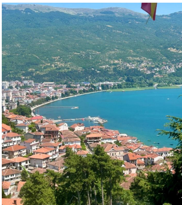
Slika 3. Grad Ohrid i Ohridsko jezero

Razgovori s kolegama bili su vrlo dragocjena prilika za razmjenu iskustava; dobili smo uvid u njihove svakodnevne izazove – kao što su ograničeni kadrovski i prostorni resursi, potreba za digitalizacijom i upravljanjem velikim fondom, ali i prilike – naime, snažnu povezanost s lokalnom zajednicom, rad s djecom i mladima, te očuvanje kulturnog