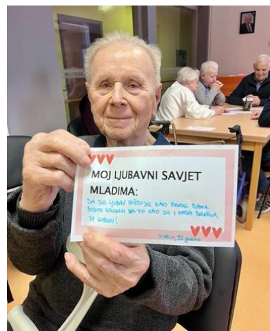
Slika 2. Interaktivna radionica

Nakon popunjavanja kartica, sudionici su naizmjenice čitali svoje odgovore, što je pokrenulo rasprave, pitanja, ali i smijeh. Saznali su tako neke nove informacije jedni o drugima, podijelili su sretna i neka bolna iskustva te dali mudre ljubavne i životne savjete za današnje mlade. Radionica je završena uz ljubavne pjesme, koje su sudionici spontano uglas zajedno otpjevali.