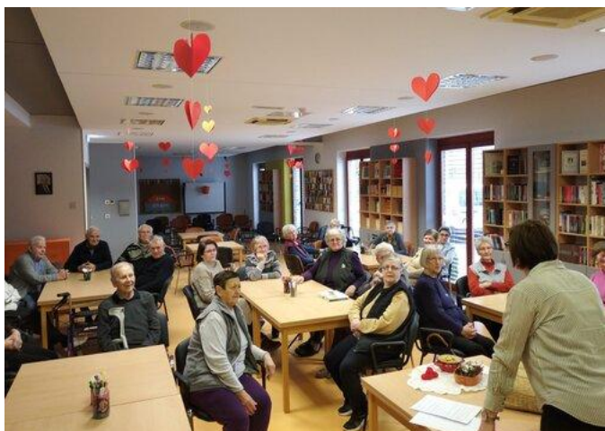
Slika 1. Pripovijedanje tradicionalnih međimurskih priča