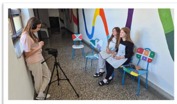
Slika 4. Proces snimanja dokumentarca

Vrijednost je ovoga projekta u tome što je obuhvatio različite aspekte vizualnih i performativnih umjetnosti, omogućujući učenicima da kroz suradnju otkriju nove vještine, razviju kritičko mišljenje i potaknu svoju maštu. Zajednički umjetnički radovi bili su predstavljeni na završnoj izložbi, čime su se promovirale sve aktivnosti i uspjeh sudionika. Kroz ovaj projekt bilo je objedinjeno nekoliko izvannastavnih aktivnosti koje se već provode u školi, a uvela se i nova aktivnost – tkanje. 6 U projektu je sudjelovala likovna grupa, grupa tkanje na malim stalcima, školski zbor i bend, lutkari, keramičari i filmska družina „Mladi SKIG-ovci“. U suradnji s Multimedijalnim centrom Studio kreativnih ideja Gunja (MMC SKIG) dokumentiran je cijeli tijek nastanka i rad cijelog projekta kroz kronološki prikaz događaja u školi u vidu dokumentarca. (Slika 4.)