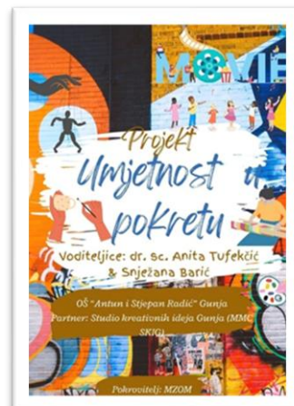
Slika 3. Plakat projekta „Umjetnost u projektu“

Osnovna škola „Antun i Stjepan Radić“ Gunja u suradnji sa školskom knjižnicom prijavila se na javni Poziv za financiranje projekata u sklopu izvannastavnih aktivnosti osnovnih i srednjih škola te učeničkih domova u školskoj godini 2024./2025. Ministarstvo znanosti, obrazovanja i mladih školi je odobrilo iznos od 1.800 eura za provedbu projekta: „Umjetnost u pokretu“, a u svrhu promocije projekta izrađen je i promo plakat (Slika 3.)