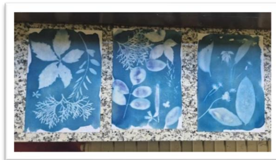
Slika 2. Cijanotipije – plavi otisci biljaka

projekta, u suradnji s nastavnicom biologije Eminom Durmić i nastavnicom likovne kulture Marijom Vidaković Tulić. Radionica je provedena u učionici na otvorenom, gdje su učenici izrađivali svoje prve „sunčeve otiske“ – autentične i jedinstvene cijanotipije, nastale izlaganjem papira premazanog otopinom željeznih soli Sunčevoj svjetlosti. 4 (Slika 2.)