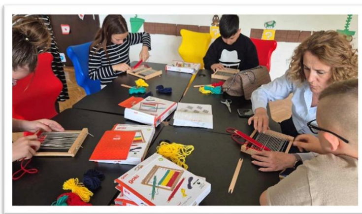
Slika 6. Radionice tkanja

U okviru projekta učenici su također učili osnove tkanja koristeći tkalačke stalke. Zahvaljujući projektu, škola je bogatija za male, srednje i velike tkalačke stalke. (Slika 6.) Ova je aktivnost pridonosila razvoju fine motorike i kreativnog razmišljanja.