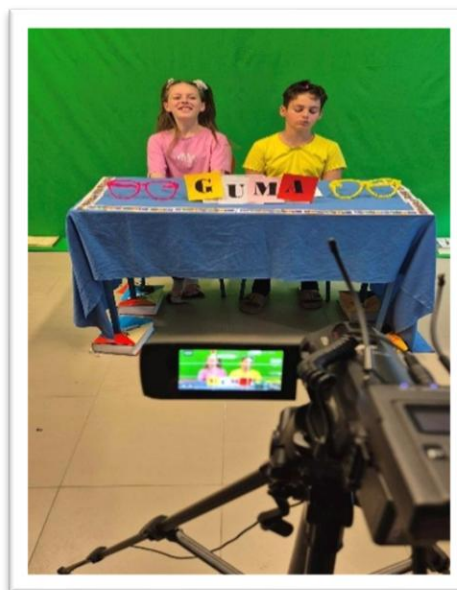
Slika 7. Snimanje emisije GuMa

Projekt „Umjetnost u pokretu“ uključivao je i izradu jednog video priloga za Gunjanski magazin GuMa, čime je učenicima pružena prilika za razvoj filmske i medijske pismenosti, ali i dokumentiranje vlastita stvaralačkog procesa, za što je zadužena filmska dužina škole „Mladi SKIG-ovci“. (Slika 7.)