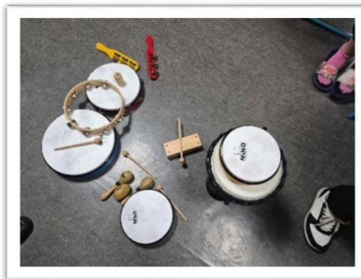
Slika 8. Novi glazbeni instrumenti

Učenici iz školskog zbora i bend pripremali su vokalne izvedbe povezane s pokretom, istražujući mogućnosti izražavanja kroz zvuk i tijelo, uz pomoć novih instrumenata. (Slika 8.) Na pozornici će oživjeti koreografirani vokalni nastupi u kojima će se pjevanje spojiti s elegantnim pokretima – naglašavajući savršeni sklad između glasa i tijela.